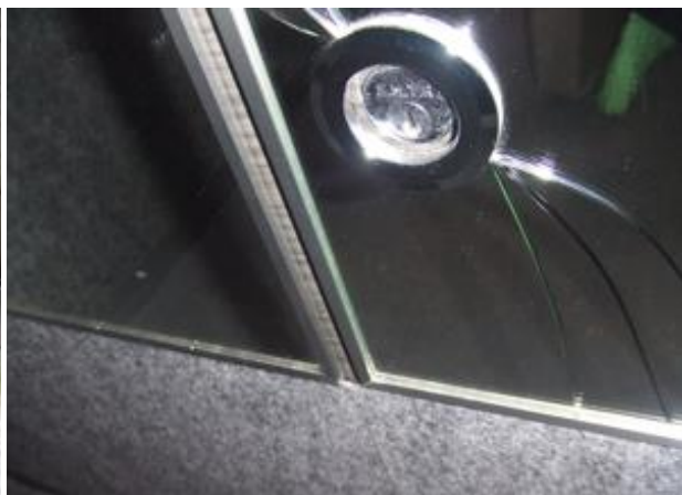
エレベーター内鏡ヒビあり