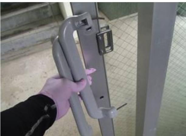
2階エレベーターホールドア取手破損