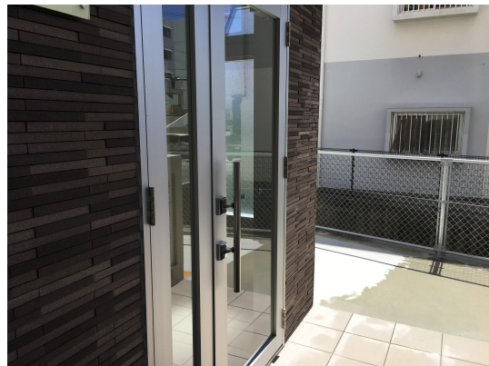
エントランスガラス