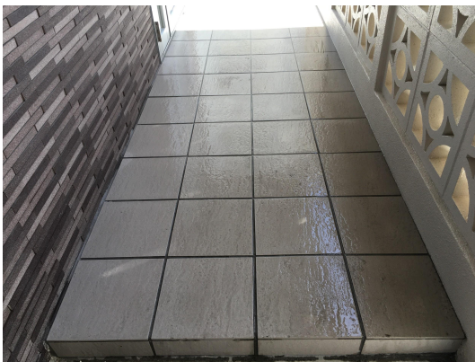
エントランススタイル