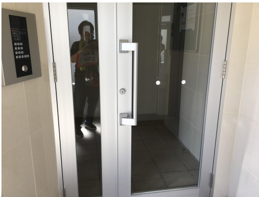
エントランスガラス