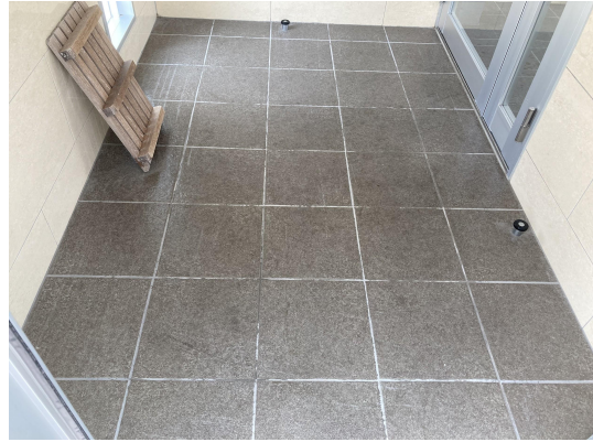
エントランススタイル