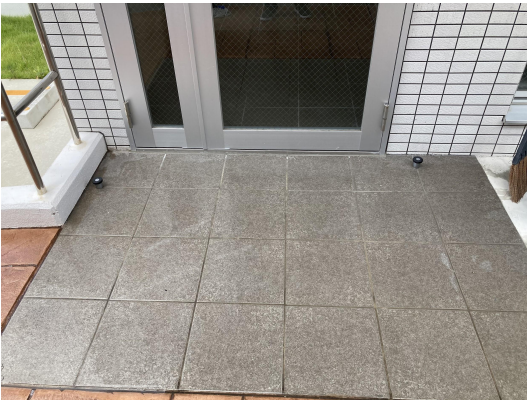
エントランススタイル