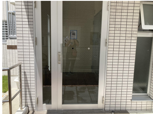
エントランスガラス