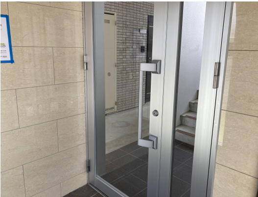
エントランスガラス