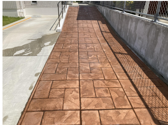
エントランススタイル