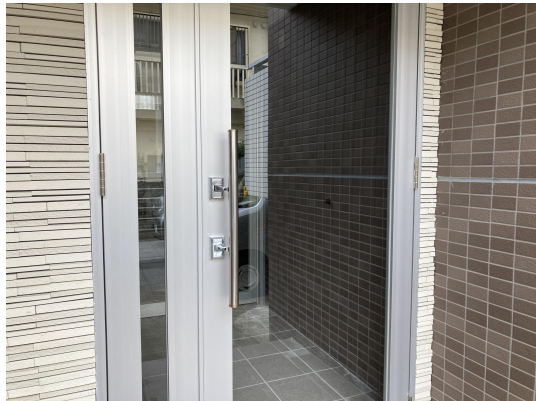
エントランスガラス