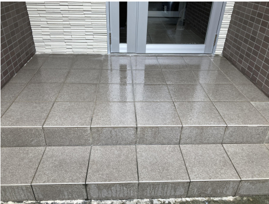
エントランススタイル