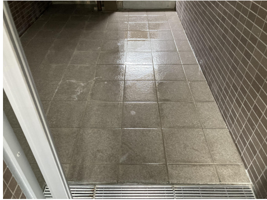
エントランススタイル