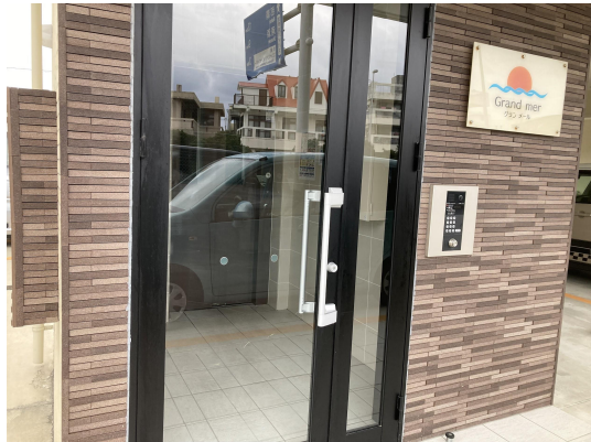
エントランスガラス