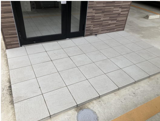
エントランスタイル