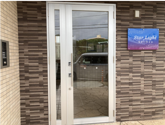
エントランスガラス