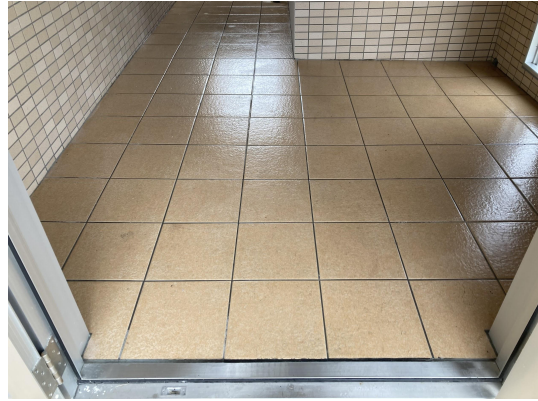
エントランススタイル