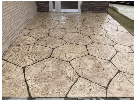
エントランススタイル