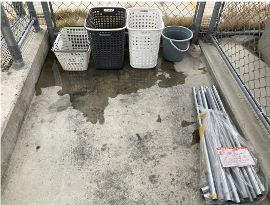
ゴミ置場・未回収ゴミあり。