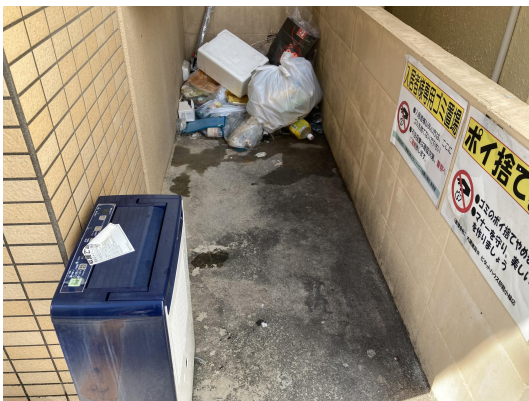
ゴミ置場・未回収ゴミあり。