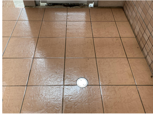
エントランスタイル