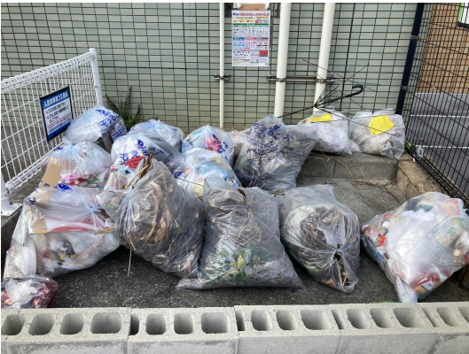
ゴミ置場・未回収ゴミあり。