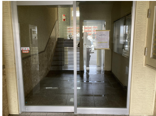
エントランスガラス