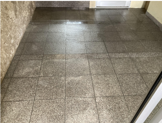
エントランススタイル