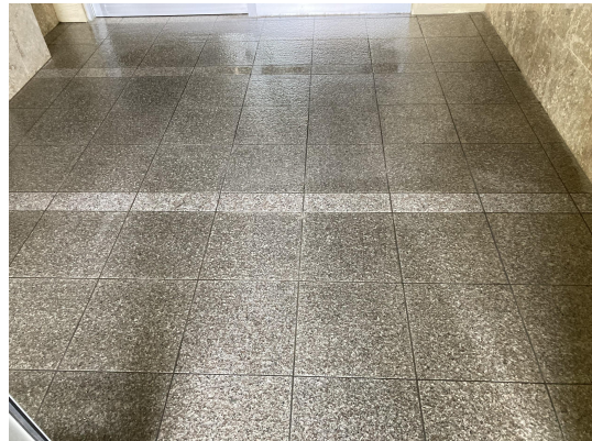
エントランススタイル