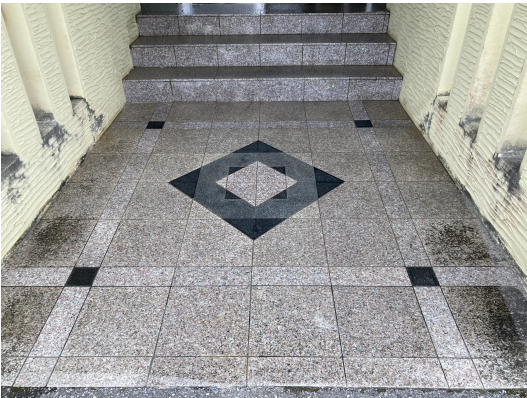
エントランススタイル