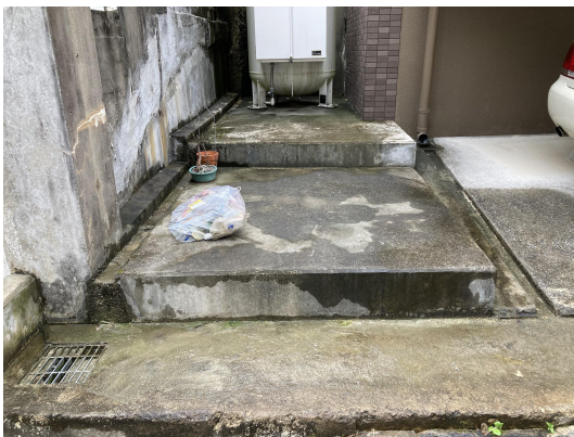
ゴミ置場・未回収ゴミあり。