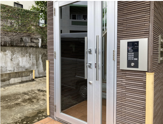
エントランスガラス