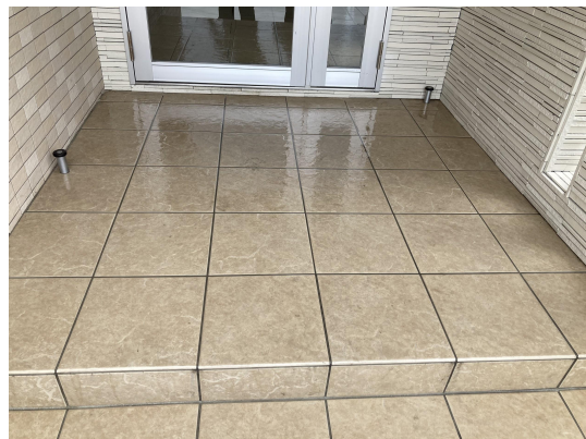
エントランススタイル