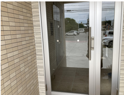
エントランスガラス