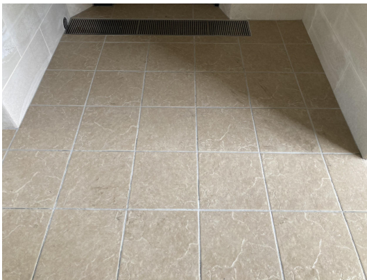
エントランススタイル