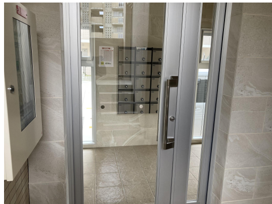
エントランスガラス