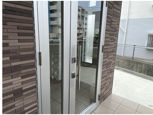
エントランスガラス