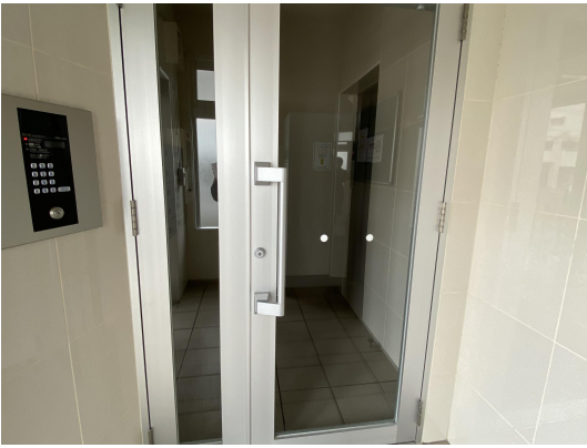
エントランスガラス