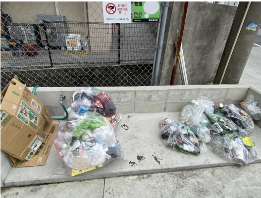
ゴミ置場・未回収ゴミあり。