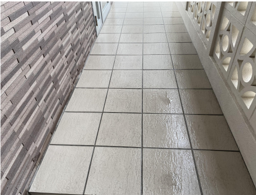
エントランスタイル