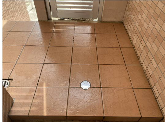
エントランスタイル