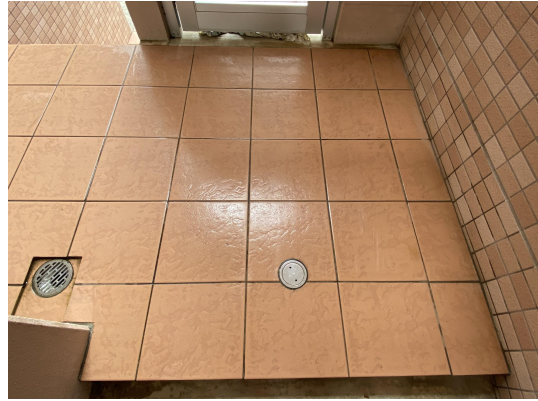
エントランススタイル