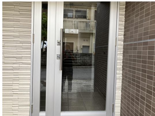
エントランスガラス