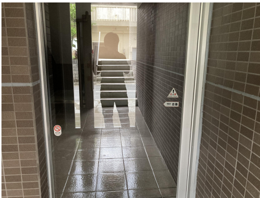
エントランスガラス