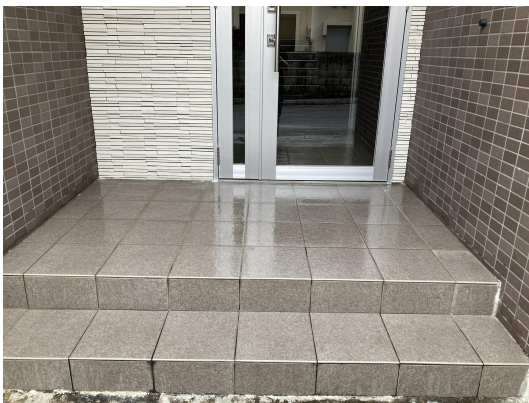
エントランススタイル