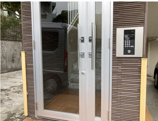
エントランスガラス