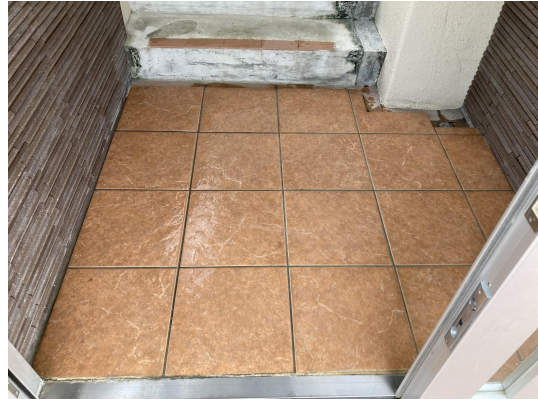
エントランススタイル