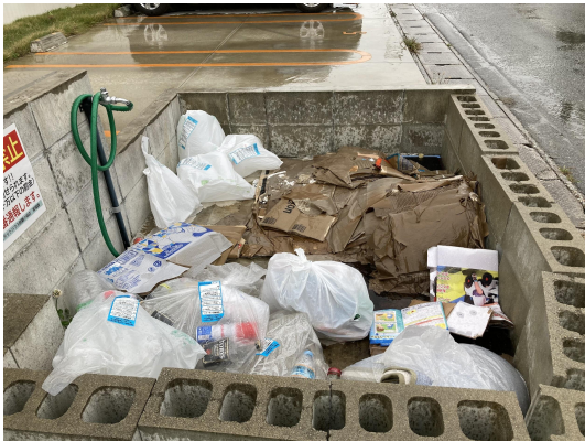
ゴミ置場・未回収ゴミ多数あり