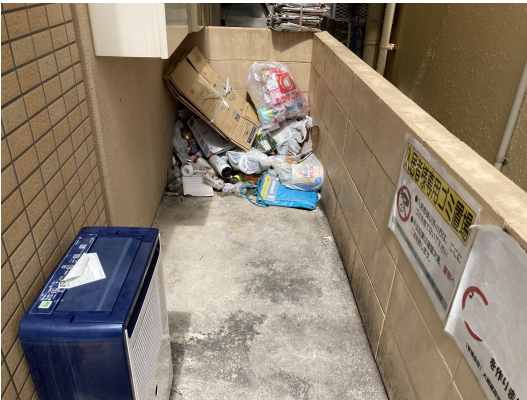
ゴミ置場・未回収ゴミあり。