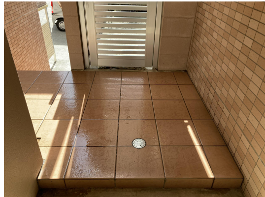
エントランスタイル