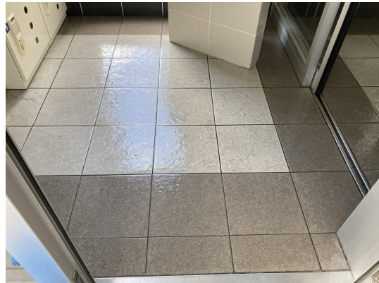
エントランススタイル