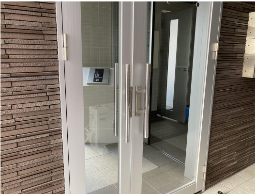
エントランスガラス