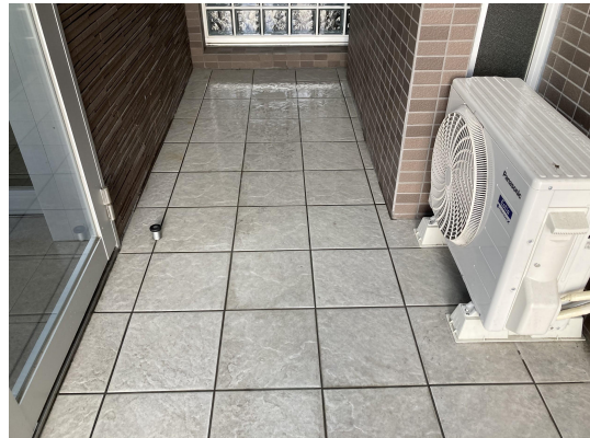
エントランススタイル