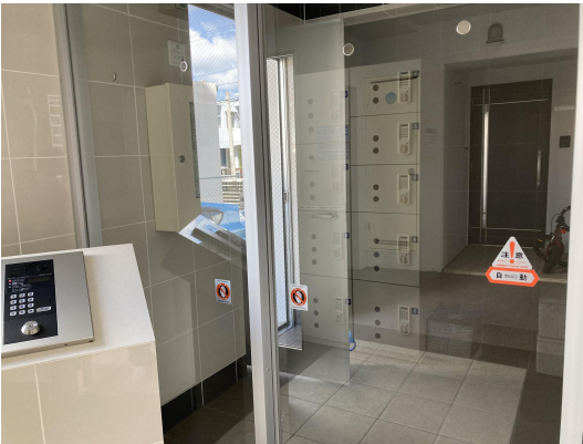
エントランスガラス