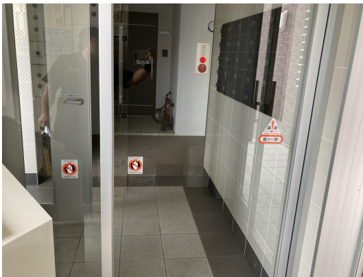
エントランスガラス