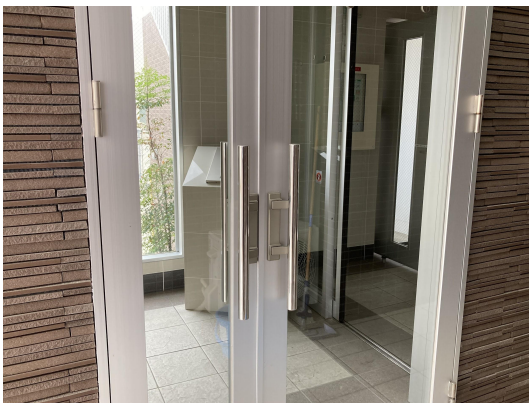
エントランスガラス