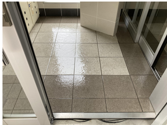
エントランススタイル