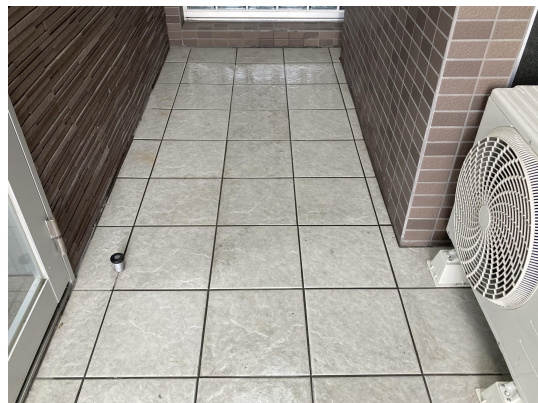
エントランススタイル