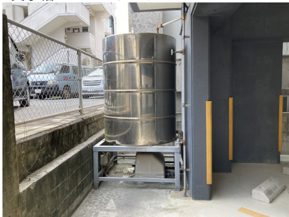
2.受水槽フェンスまわり