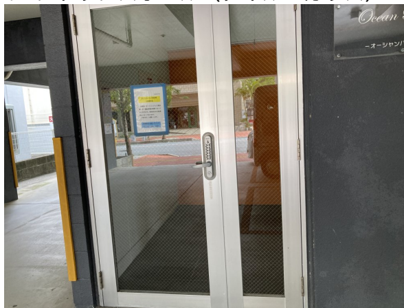
4.エントランスホール（タイル・ガラス）