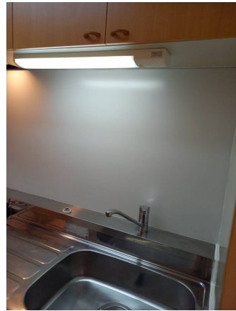
キッチン壁張り前