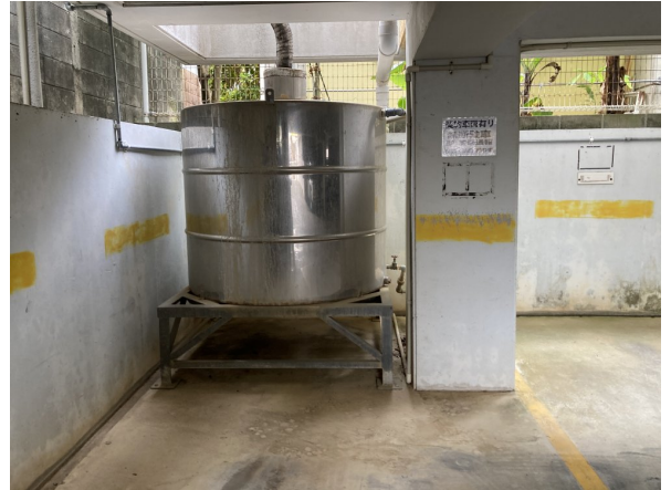
2. 受水槽フェンスまわり