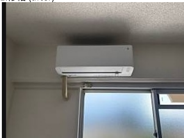
エアコン取付工事