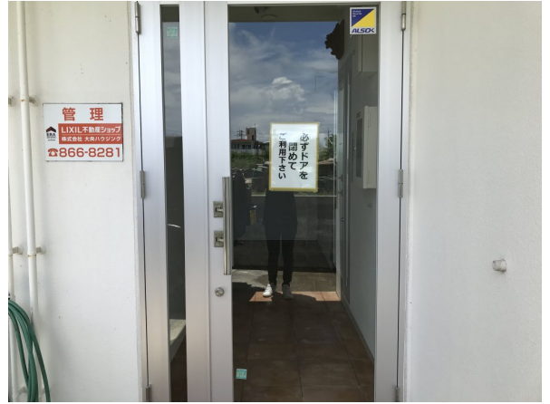
4.エントランスホール（タイル・ガラス）