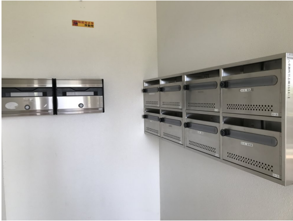
5.集合ポスト・看板