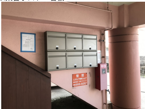
3.集合ポスト・看板