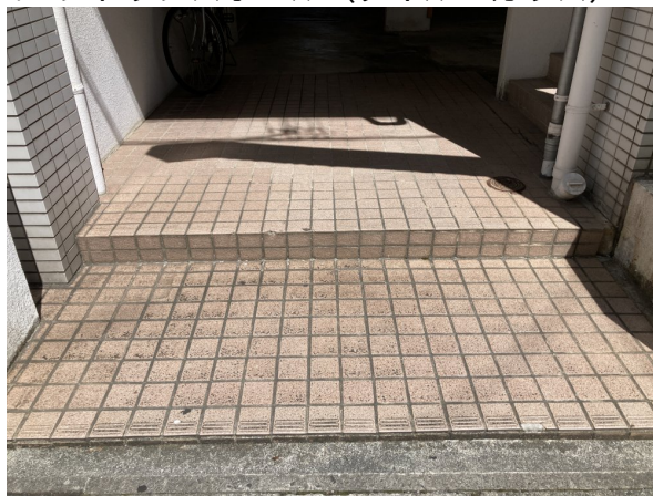
4.エントランスホール（タイル・ガラス）