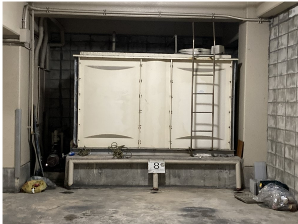
2. 受水槽フェンスまわり