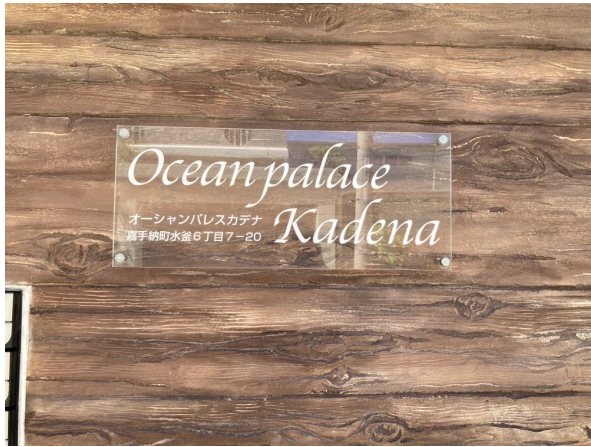
4.集合ポスト・看板