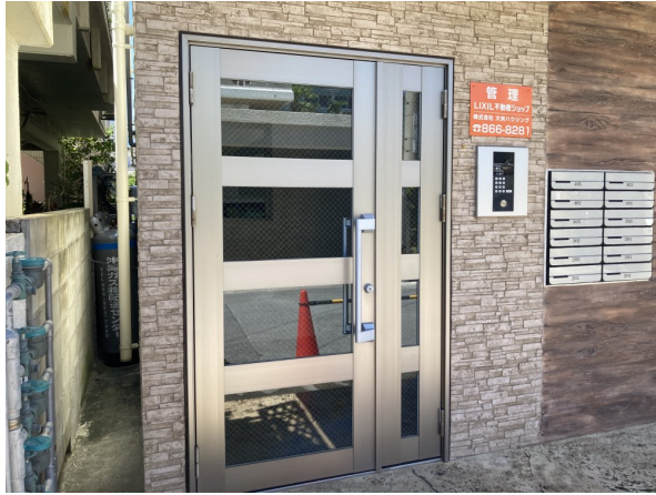
3.エントランスホール（タイル・ガラス）