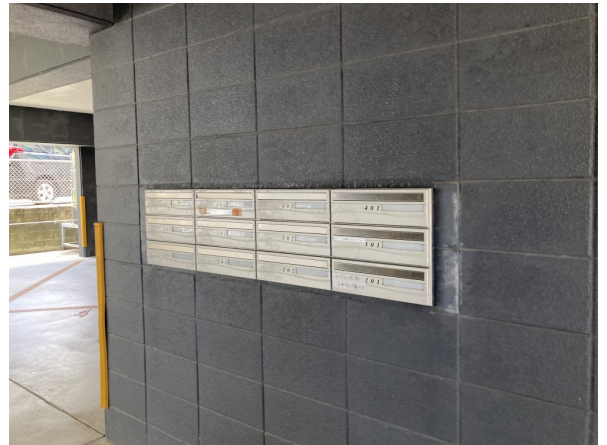
5.集合ポスト・看板