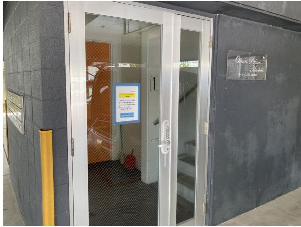
4.エントランスホール (タイル・ガラス)