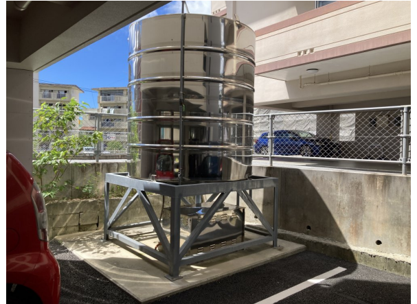
2. 受水槽フェンスまわり