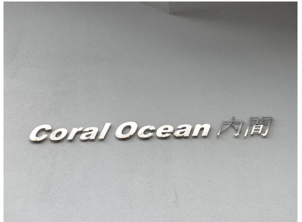
4.集合ポスト・看板