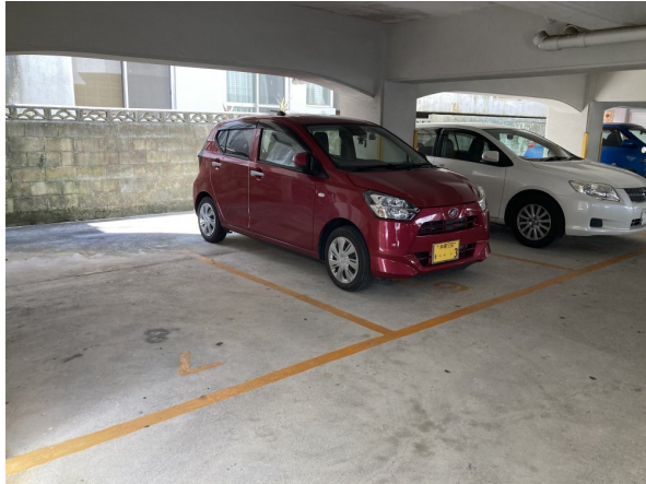
2.受水槽フェンスまわり