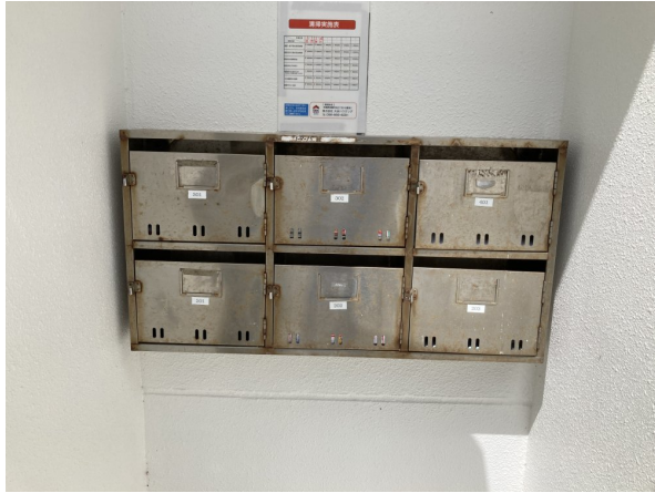
4.集合ポスト・看板