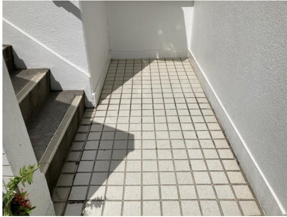
3.エントランスホール（タイル・ガラス）