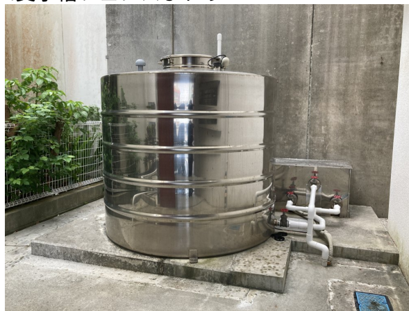
2. 受水槽フェンスまわり