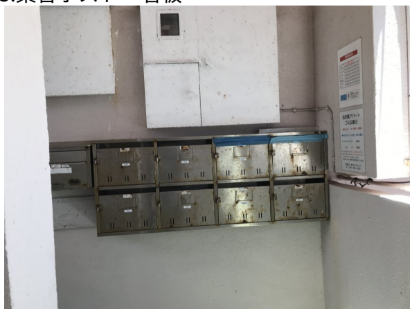
3.集合ポスト・看板