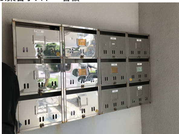
5.集合ポスト・看板