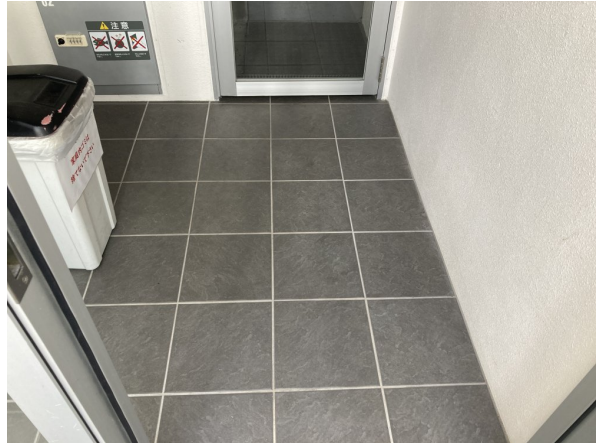
4.エントランスホール（タイル・ガラス）