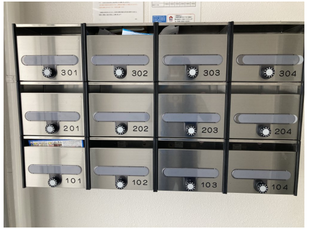
5.集合ポスト・看板