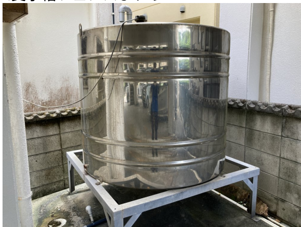
2. 受水槽フェンスまわり