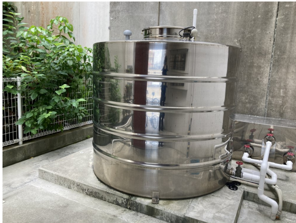
2. 受水槽フェンスまわり