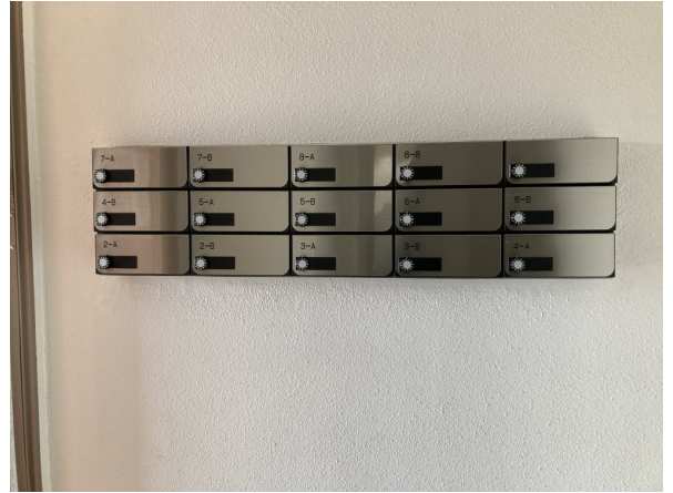
6.集合ポスト・看板