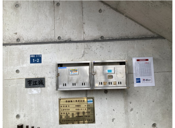
4.集合ポスト・看板