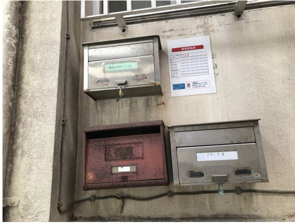
2.集合ポスト・看板