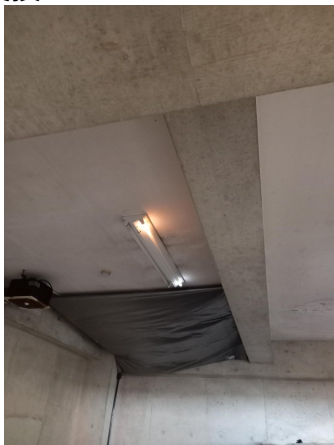
地下駐車場 右側奥 40W直管 2本切れ