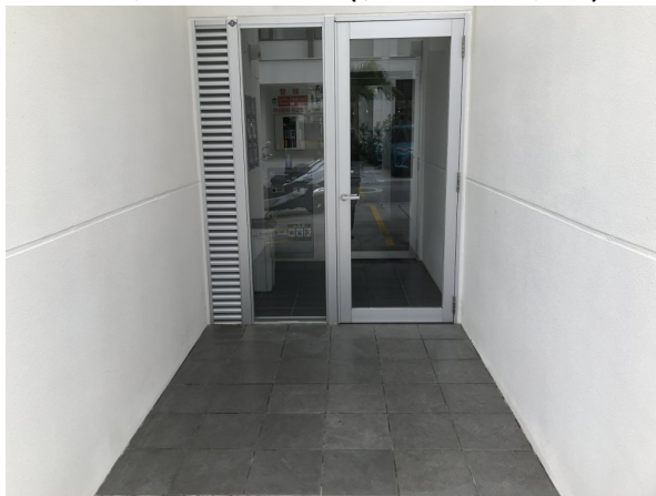
3.エントランスホール（タイル・ガラス）