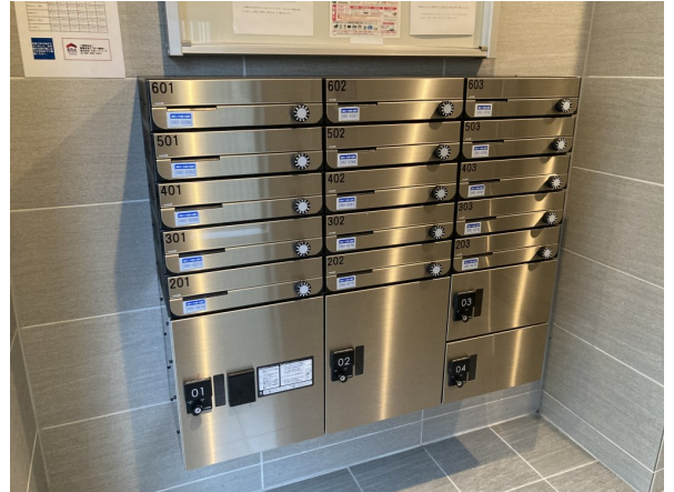
6.集合ポスト・看板