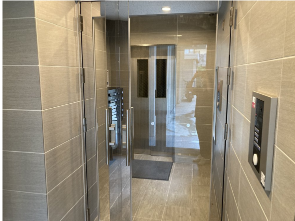
5.エントランスホール（タイル・ガラス）