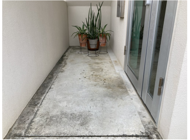
3.エントランスホール（タイル・ガラス）