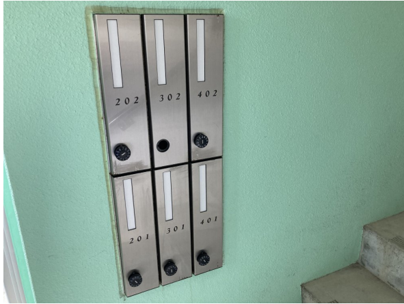
4.集合ポスト・看板