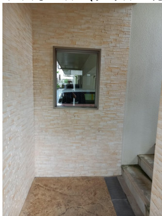
3.エントランスホール（タイル・ガラス）