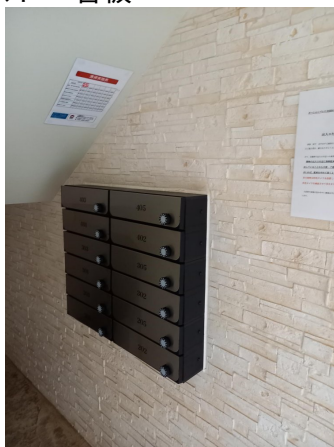
4.集合ポスト・看板